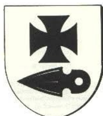
HAGENTHAL LE HAUT